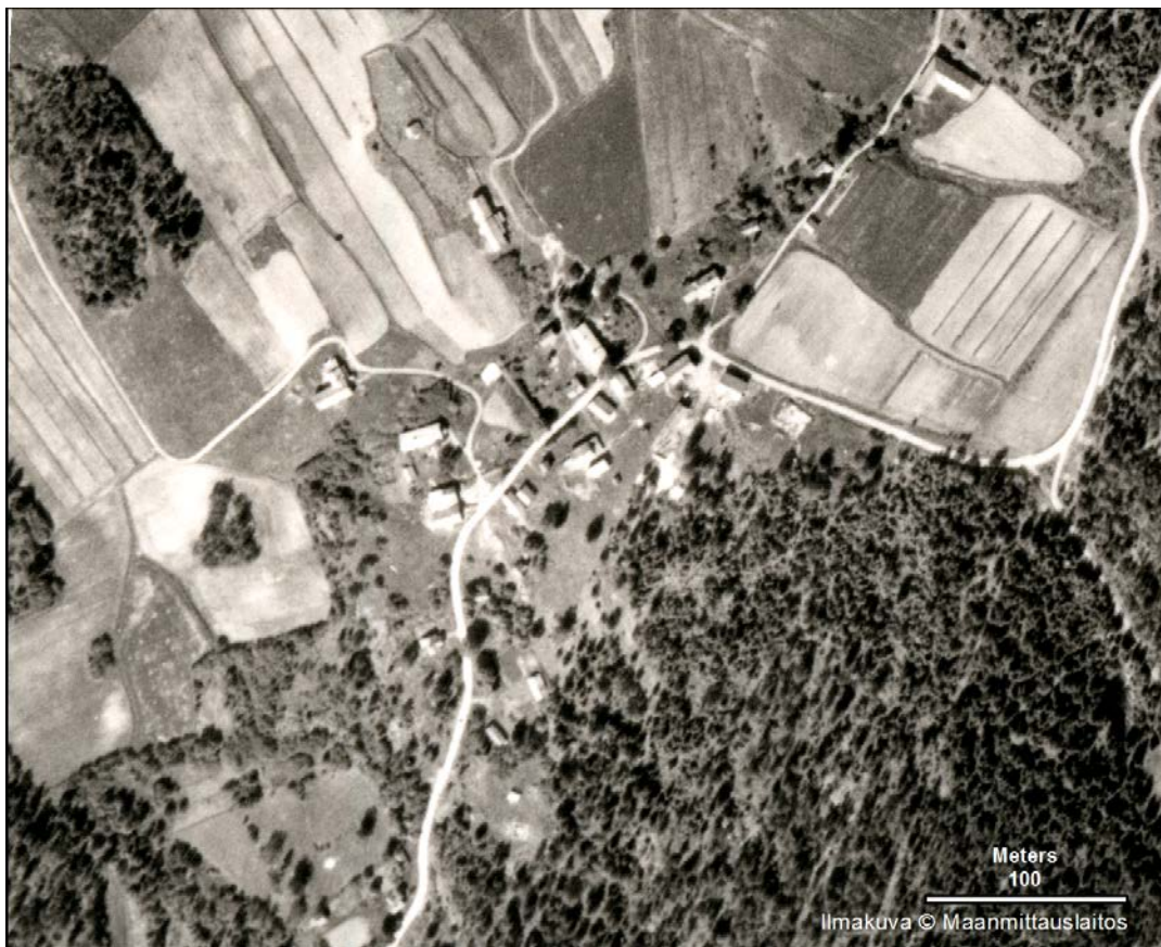
Paunin kylänraitti Immulantien varrella aurinkoisena kesäpäivänä 23.6.1955